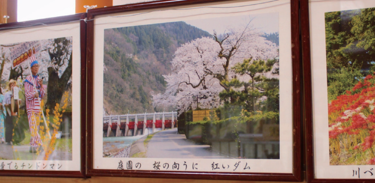
参るチンドンマン